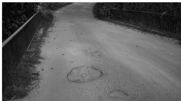
Pont del Matador