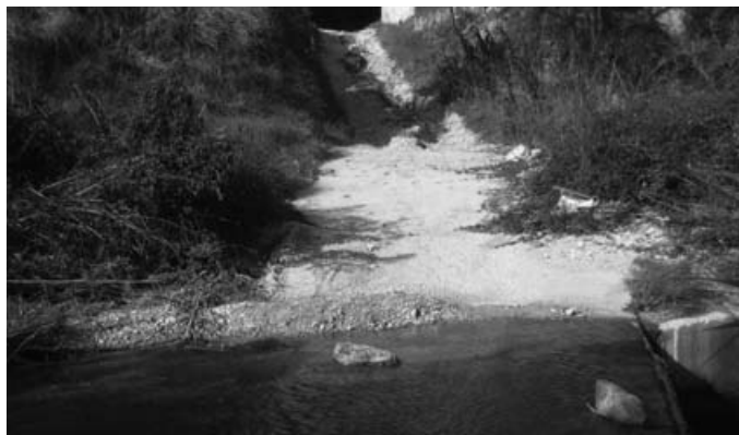
Camí del Pas de l'Anguilar

Ací vos mostrem l'estat lamentable en el qual es troben alguns dels camins rurals del terme d'Albaida. Segurament, hi ha molts més camins que també es troben en la mateixa o pitjor situació, però hem volgut reflexar amb estes imatges la "gestió" que porta a cap l'equip de govern del PP en el manteniment i la millora de les vies rurals. I és que són moltes les reclamacions i les signatures presentades pels usuaris dels camins rurals a l'Ajuntament d'Albaida demanant l'acondicionament d'estos i altres camins, però pareix que cauen en sac foradat. I aquesta situació s'explica menys encara quan a l'Ajuntament d'Albaida se li va concedir una subvenció de 40.000 euros dintre de les actuacions incloses al Pla de Camins Rurals que va aprovar la Diputació de València en maig de 2009. Pel que es veu, no s'han destinat a reparar l'estat lamentable en el qual es troben els camins del terme d'Albaida. Esperem que aquestes imatges no caiguen tampoc en l'oblit dels governants actuals d'Albaida i es destinen eixos diners a reparar els camins del terme.