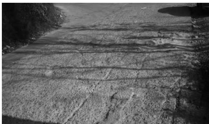
Camí d'Atzeneta - Entrada del Pansat