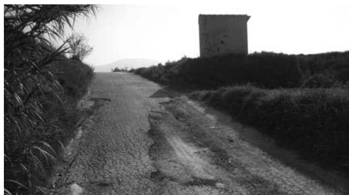
Camí de la Vega